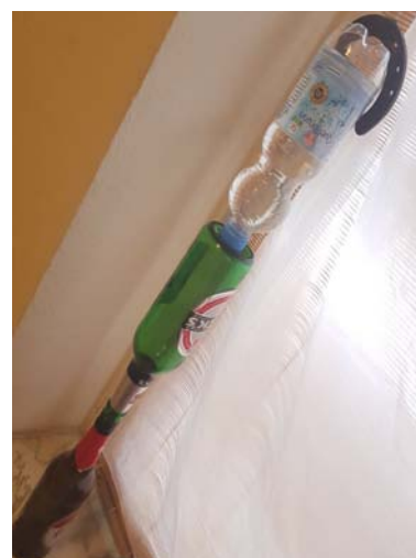
Rezas Lockdown Balance

The efforts of the last years in the work with refugees and the little success is fragil. With the lockdowns of the pandemia, people are missing their education programs, loose their jobs and miss the exchange in Performance- and Theatre Projects. Take care.